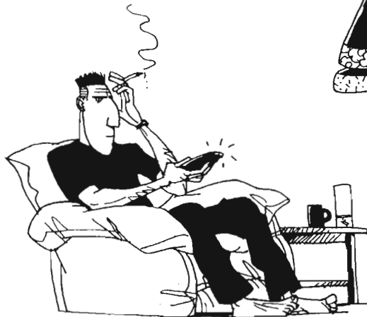
דויד לא לומד.