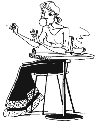
רחל לא לומדת.