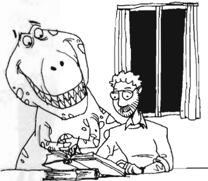
דני לומד זואולוגיה.