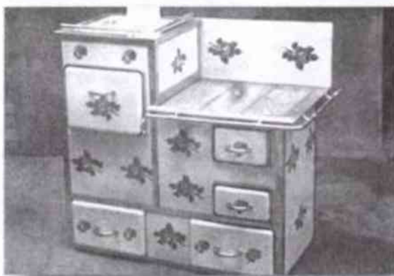
Taková kamna se vyráběla speciálně pro kočovné vozy a maringotky v městě Slaném; foto ze sbírek Muzea romské kultury.

Ve voze byla velká postel a z pod ní se vytahoval dřevěný rošt, což bylo široké