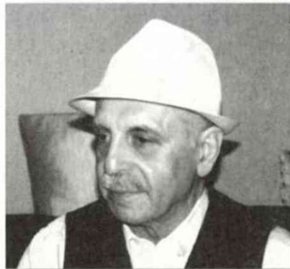
Tatínek, už v pokročilém věku

Musím ještě napsat o Zdaboři. Naším se zastesklo po volném životě – ve voze – a vyjeli jsme ještě asi dvakrát do světa.