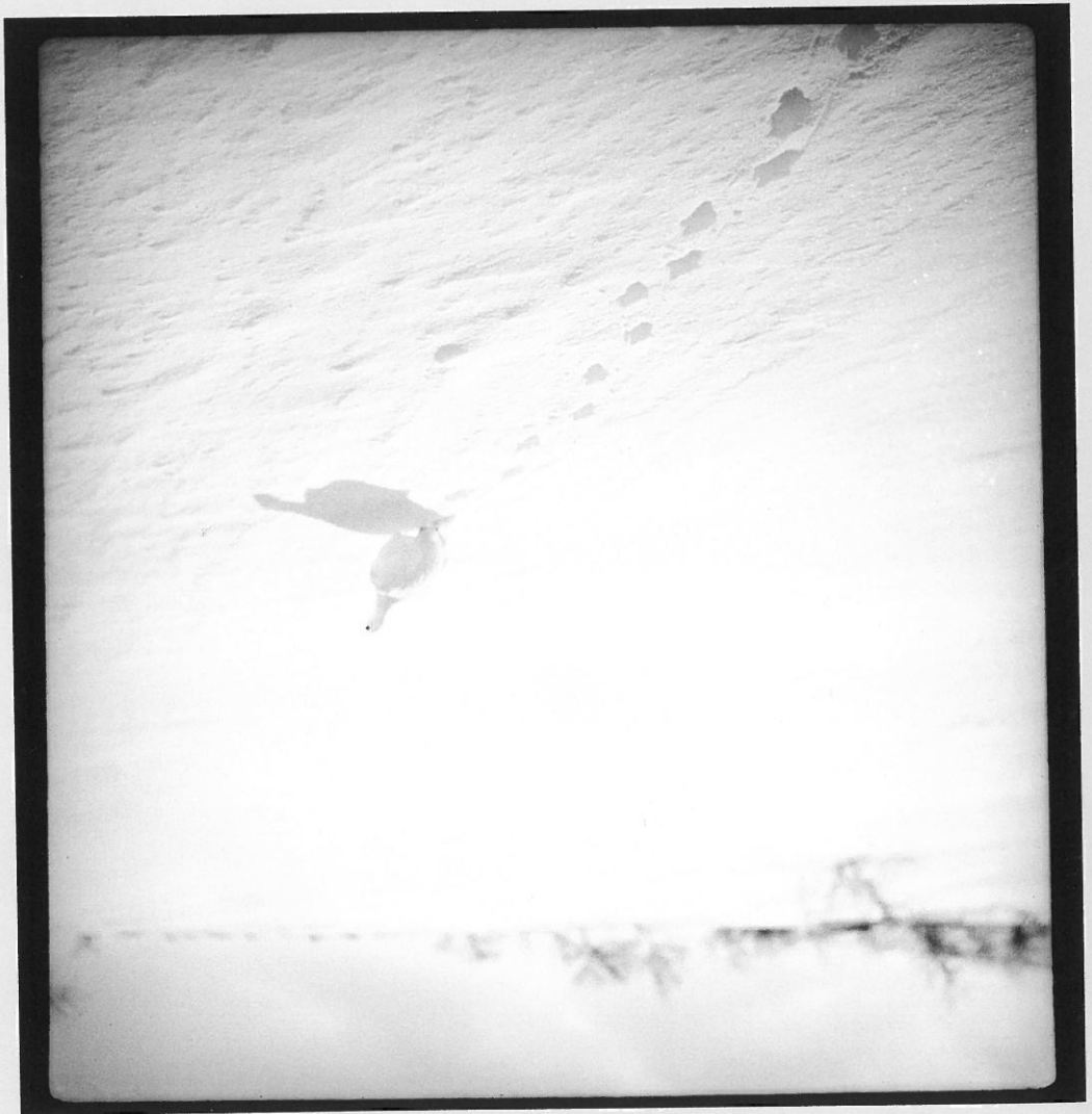
En fjellrype-hann i vinterdrakt, 6. april 1938.

hendelser som dyp, bryllup og begravelse. Det for å fotografere alle generasjoner samt viktige ingen annen fotograf i dalen, så Marek ble ofte benyttet av samer og den norske bondebefolkninga. Det fantes i fotoarkivet finner vi også mange portretter, både benyttet i boka si om samene i Susendalen. Børgefell. Det er denne typen fotografier Marek selv landskapsfotografier fra skog- og fjellområdene ved og andre dagligdagse gjøremål, deres boplasser, samt og menn. Vi finner bilder fra sammens arbeid med rein for kulturen og hverdagslivet for sør-samiske kvinner