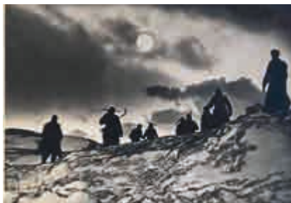
Velkolepé plány celoevropské dopravní infrastruktury realizovali zotročení zajatci, vězni koncentračních táborů a nuceně nasazení dělníci z okupovaných zemí

Zvláštní kapitolou historie nuceného nasazení je spolupráce místních firem v jednotlivých okupovaných zemích. Organizace Todt sloužila především jako generální platforma a jako řídicí, zabezpečovací a kontrolní orgán. Na jednotlivé stavby ale většinou kontraktovala konkrétní civilní firmy, kterým zajišťovala materiál, popřípadě stroje, a také pracovní síly a jejich dozor. Přemíru úkolů nebyly schopny zvládnout německé firmy samy, a proto mezi zaměstnavateli nuceně nasazených najdeme i podniky francouzské, nizozemské či norské. Pro vybrané podnikatele zakázky znamenaly nejen určitý zisk, ale především existenční jistotu ve válečné době, a to jak pro firmu samotnou, tak pro jejího majitele a také zaměstnance. Díky přímým zakázkám se z důvodu jejich „nepostradatelnosti“ podařilo uchránit mnoho Francouzů, Nizozemců, Norů, Belgičanů nebo Čechů před odesláním do Říše. Na druhou stranu některé místní