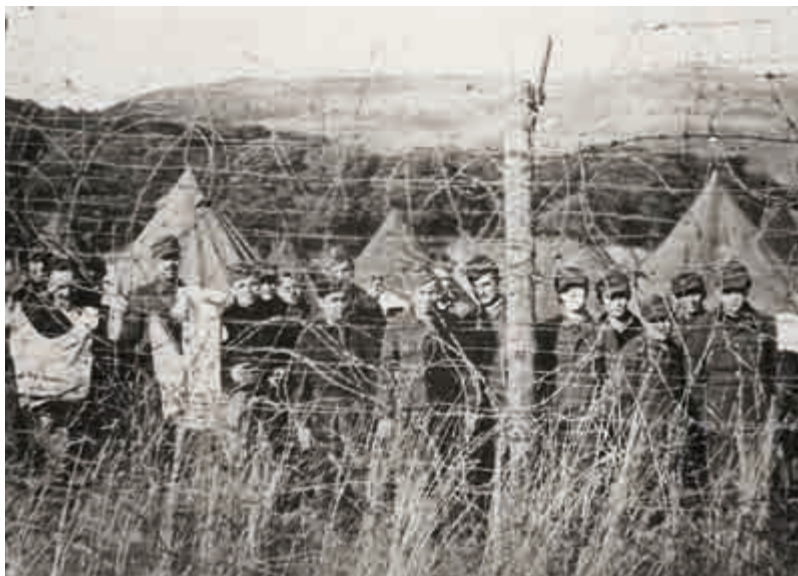
Totálně nasazení Češi, kteří sloužili přímo pod velením Organizace Todt, se po přechodu fronty často ocitli v zajateckých táborech určených pro německé vojáky

Během rychlého osvobození Francie se z německého područí vymanily tisíce a desetitisíce zavlčených cizinců. Jejich osudy bezprostředně po osvobození se odvíjely různě. Mnozí skončili v zajateckých táborech pro německé vojáky, zvláště pokud sloužili přímo pod velením Organizace Todt a nosili její uniformu či uniformě se podobající pracovní úbory.