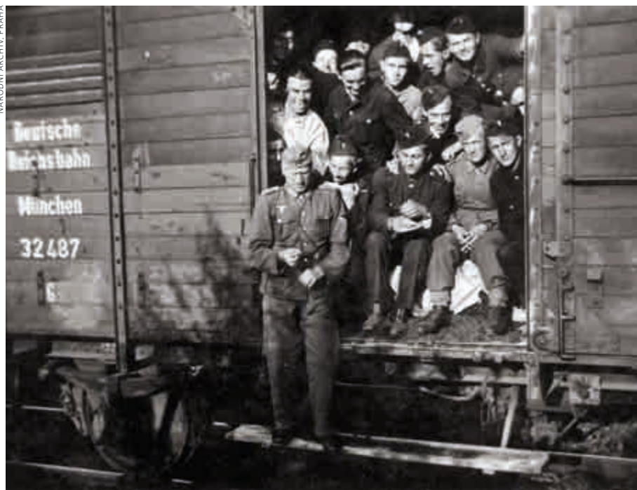
Pracovní prapor (L) 12 na cestě do Brém

Již v létě 1942 dostala okupační správa v protektorátu příkaz, aby dodala do Říše kontingent několika tisíc tesařů, zedníků, sklenářů a pokrývačů. Jejich úkolem se stalo odstraňování škod, které byly způsobeny intenzivní leteckou válkou. Pro tento účel začala být totiž v Německu vytvářena Organisation L (Luftschädenbeseitigung) , která byla složena z válečných zajatců a příslušníků okupovaných národů. Tvořila takzvaný doprovod branné moci, což znamenalo nejen vojenské velení, ale i skutečnost, že řemeslníci, které pracovní úřady povolaly do této uniformované formace, sice měli status civilních zaměstnanců a pobírali mzdu, ale současně podléhali trestnímu řádu německé armády a jiným vojenským předpisům. Byli zformováni do pracovních praporů, které se staly součástí územní organizace wehrmachtu.