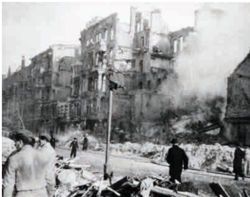
NÁRODNÍ ARCHIV, PRAHA