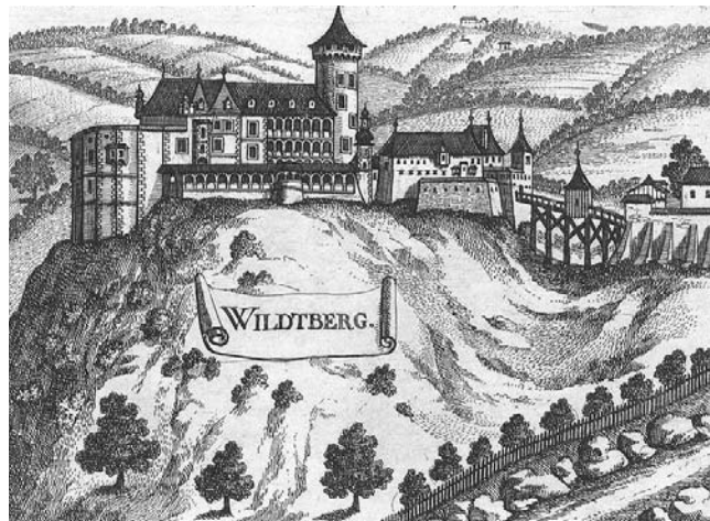
Hrad Wildberg u Lince na rytině ze 17. století. Právě zde byl po dočasné internaci na Českém Krumlově od počátku července vězněn král Václav. Držitelé hradu, Kašpar a Gundaker ze Starhembergu, patřili mezi spojence Jindřicha z Rožmberka; později se oba rody i příbuzensky spřiznili. Na hradě ležícím na důležité obchodní stezce mezi Čechami a Rakousy pobyl český král necelý měsíc.

Vedle nových spojenců získala jednotu počátkem června i silného protivníka. Václavův bratr Jan Zhořelecký vytušil svoji šanci a ostře se proti jednotě