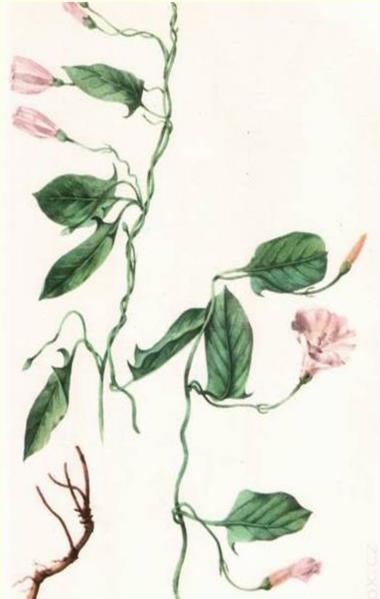
svlačec rolní ( Convolvulus arvensis )