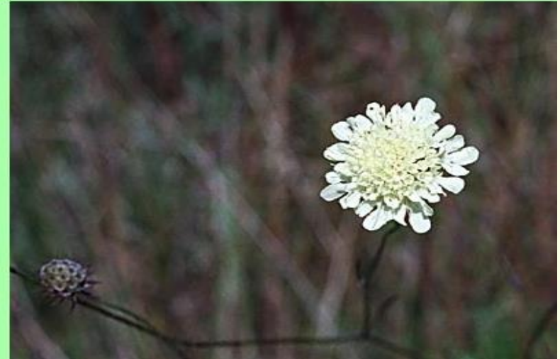
štětka planá ( Dipsacus sylvestris ) štětkovité ( Dipsacaceae )