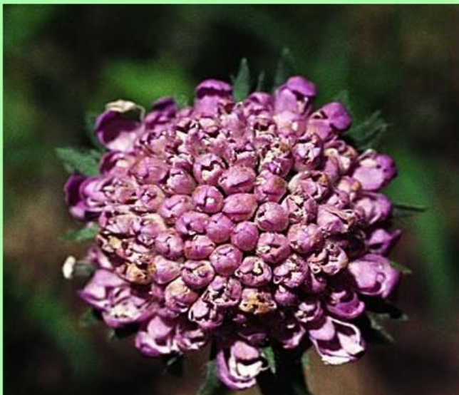
chrastavec rolní ( Knautia arvensis ) štětkovité ( Dipsacaceae )