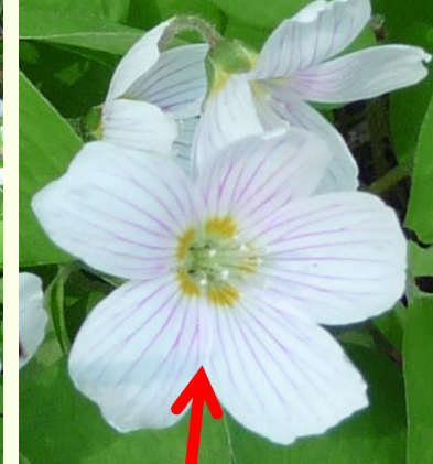
bělavé květy s fialovými žilkami