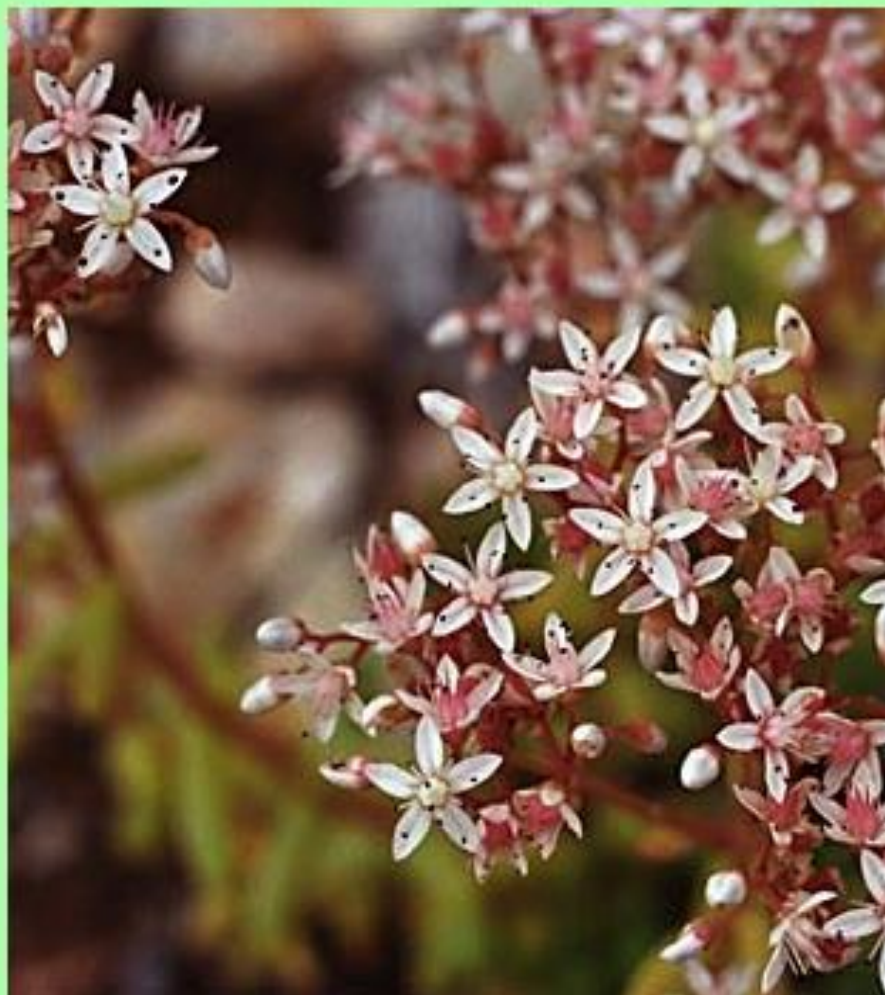
rozchodník bílý ( Sedum album ) tlusticovité ( Crassulaceae )