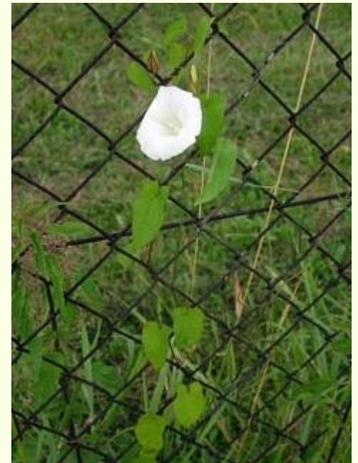
opletník plotní ( Calystegia sepium )