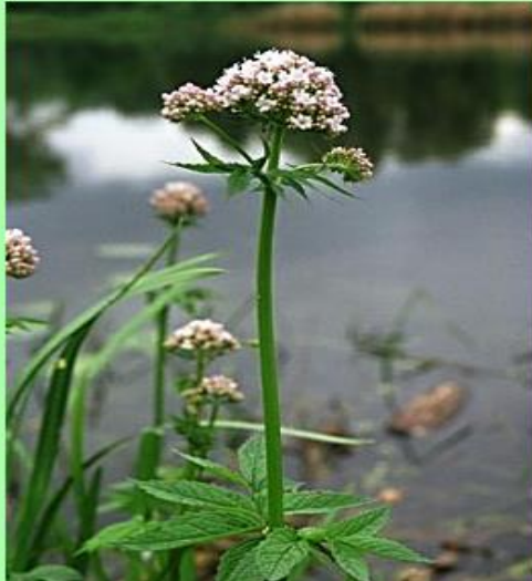
chrastavec rolní ( Knautia arvensis ) štětkovité ( Dipsacaceae )