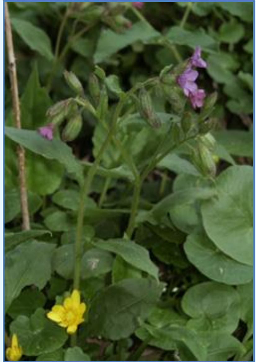
plicník lékařský ( Pulmonaria officinalis )