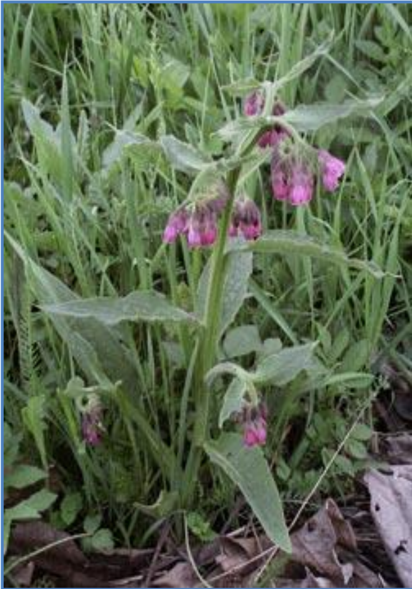
kostival lékařský ( Symphytum officinale )