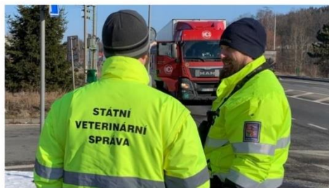
Veterináři s policií a celníky kvůli kauze s polským masem kontrolují kamiony u hranic s Polskem. Foto grafie z Královéhradeckého kraje | Foto: Martin Pařízek | Zdroj: Český rozhlas

Brusel/Praha 16:15 28. 2. 2019 (Aktualizováno: 18:10 28. 2. 2019)