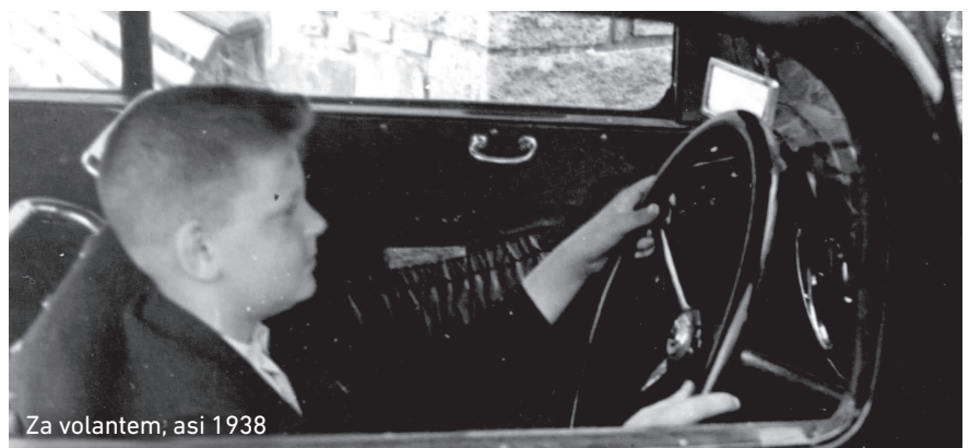
Za volantem, asi 1938