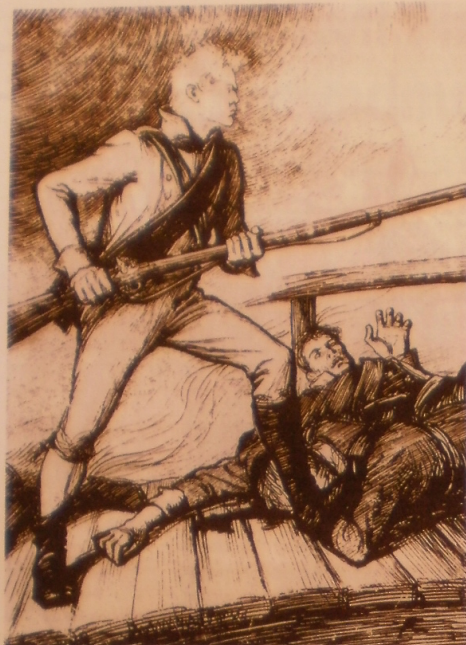
Albert Edelfelt, Sven Duřva utóčí s nasazeným bajonetem na mostě Virta Bro, v jednom z letních střetů mezi Švédy a Rusy ve středním Finsku. Ilustrace k Runebergovým Příběhům praporečnicka Stála . Voják z Edelfeltovy kresby se stal jakýmsi prototypem mužného finství.

četně silnější, ale zcela užaslá švédská posádka zmožila jen na vyjednání volného odchodu. Poprvé od roku 1742 se tak boje přenesly i do vlastního Švédska.