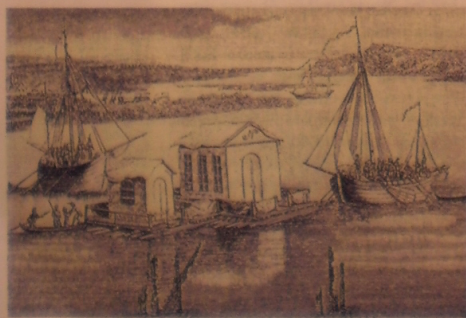
Osud Finska se rozhodoval na velkém vóru zakotveném na řece Němuru u Týlže, nedaleko pilířů zničeného mostu. Větší pavilon určený k setkání císařů nesl v západním štítu velké „N“ jako Napoleon a na východním štítu „A“ jako Alexandr.

H exametry finského (švédsky písničho) národního básníka Johana Ludviga Runeberga