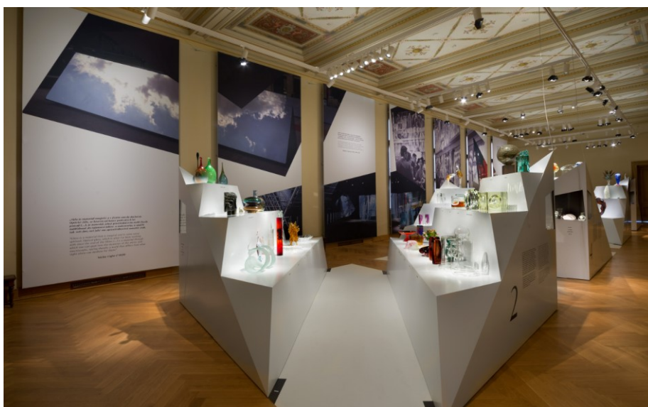
PLEJÁDY SKLA 1946-2019