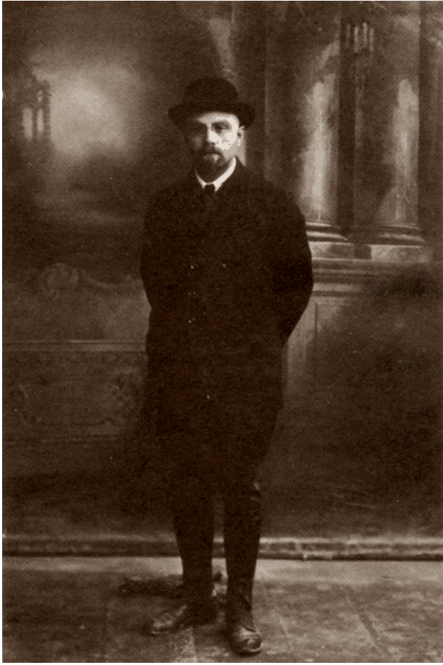
Jacob Israël de Haan