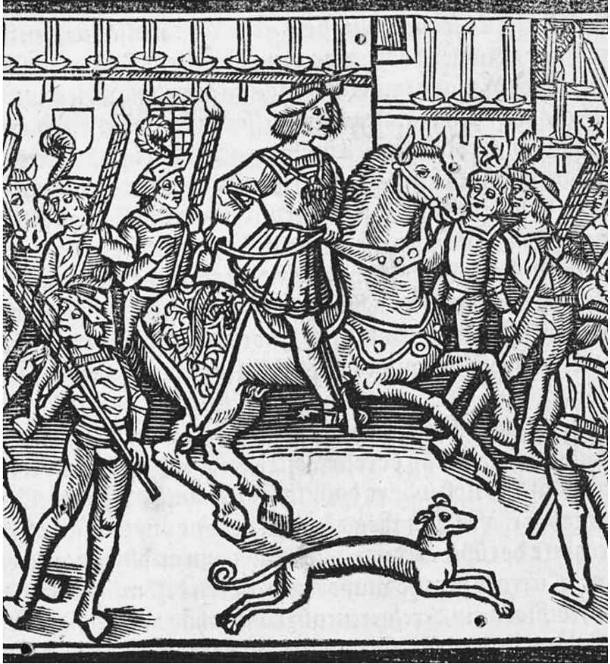
Afbeelding 2: De intrede van Karel V in Brugge in 1515. Remy du Puys, La tryumphante et solemnelle entrée faicte sur le nouvel et joyeux advenement de Charles, prince des Hespaignes en la ville de Bruges l'an 1515 le 18e jour d'april . Parijs: Gilles de Gourmont, 1515, fol. A5 r. Ex.: Brussel, Koninklijke bibliotheek van België, INC B 1553.