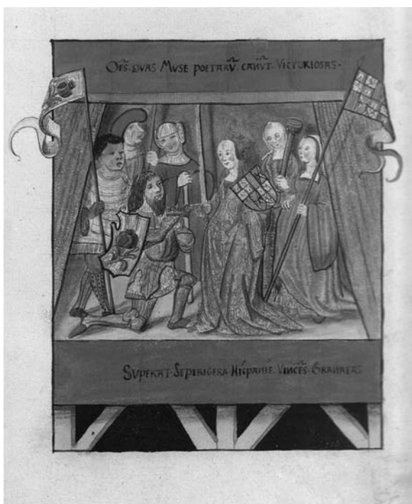
Afbeelding 6: De Moorse koning Boabdil maakt een knieval voor Isabella van Castilië. Tableau vivant vertoond tijdens de intrede van Johanna van Castilië in Brussel in 1496. Kupfurstichkabinett, Staatliche Museen zu Berlin, Preussischer Kulturbesitz, ms. 78 D5, fol. 42.