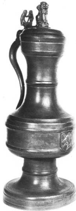
Afbeelding 4: Vijftiende-eeuwse tinnen kan met het wapen van de stad Gent. Bijlokemuseum, Gent.

Aangezien wijn in de vijftiende en zestiende eeuw nog niet in flessen werd verkocht, drukte men de hoeveelheid ervan uit in kannen van een variabele inhoud, in stopen of in gelten. 35 Het was ook in sierlijke kannen dat de drank aan de deelnemers werd geschonken. Het Bijlokemuseum in Gent herbergt een mooi tinnen exemplaar, dat dienst moet hebben gedaan voor in naam van de schepenen van de Gentse keure geschonken presentwijn (afbeelding 4).