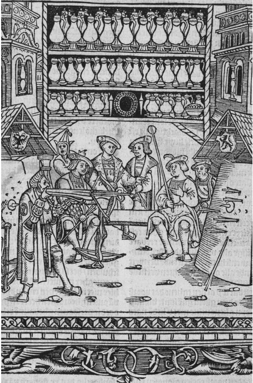
Afbeelding 3: Het feest van de voetboog in Gent in 1498, in aanwezigheid van Filips de Schone. Dits die excellente cronike van Vlaenderen. Antwerpen: Willem Vorsterman, 1531, fol. CC.lxxxvi.r. Ex.: Universiteitsbibliotheek, Gent, ACC. 12770.