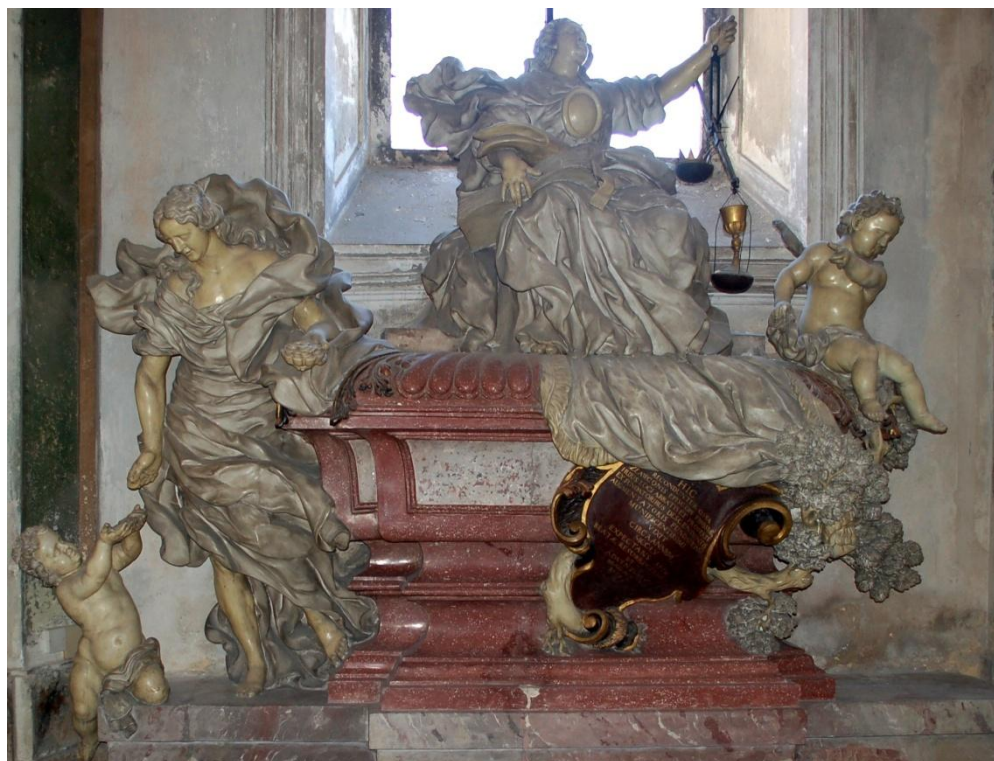
Náhrobek opata Slávka.

Ke konci 30. let 13. století Slávek Rezignoval na opatskou hodnost, Neboť byl jmenován pruským Biskupem. Pravděpodobně šlo jen o titulární hodnost, Prusko tehdy ještě zůstávalo pohanské. Snad se do Pruska vypravil. Vrátil se do Oseka, kde zemřel před rokem 1250.