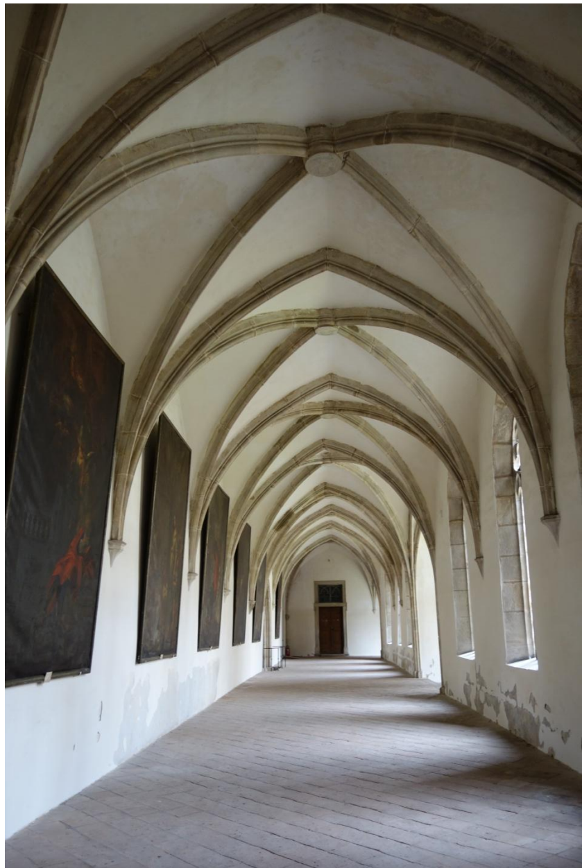
Jižní křídlo ambitu