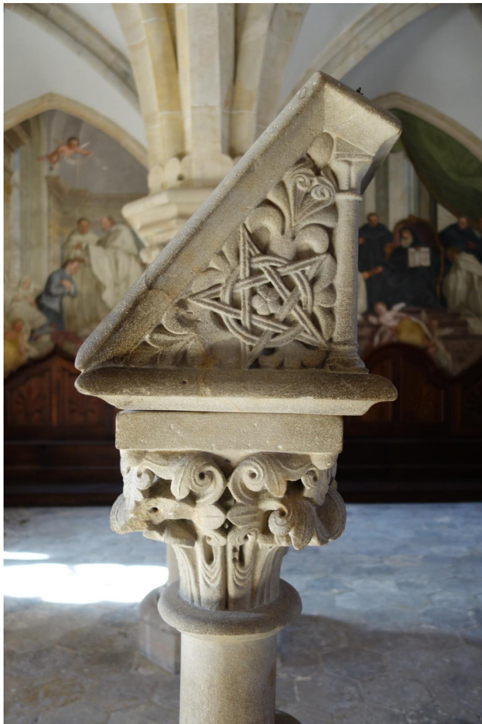
Kapitulní síň, detail pulpitu