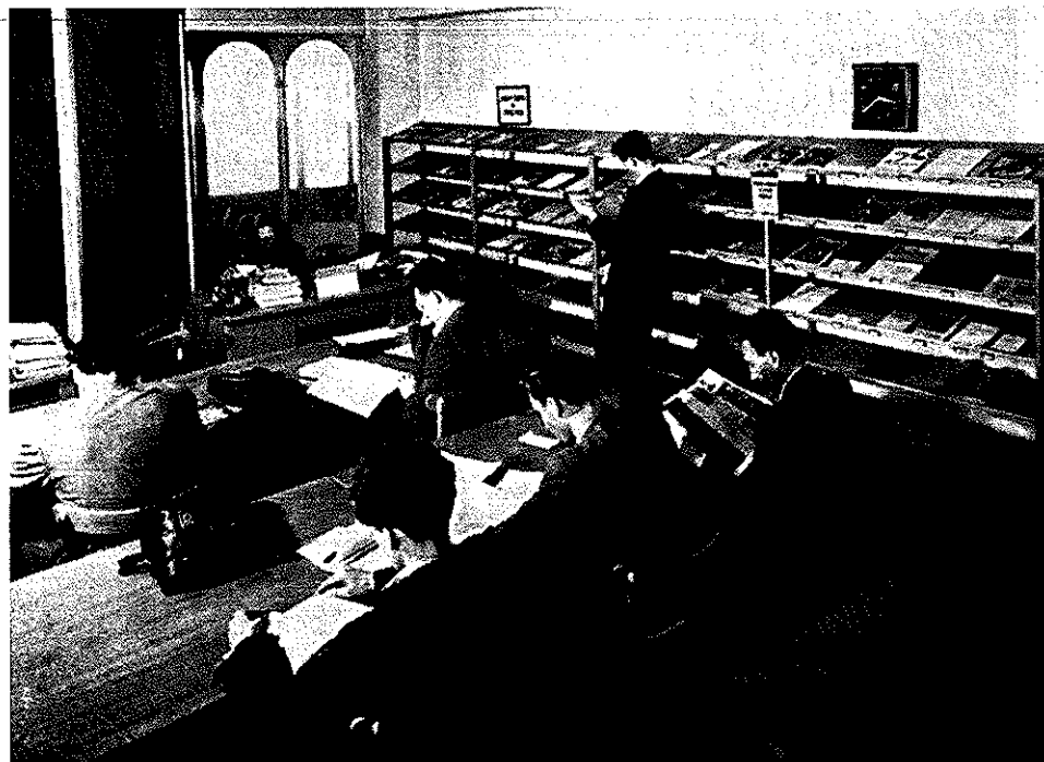
Čítárna filmového archivu