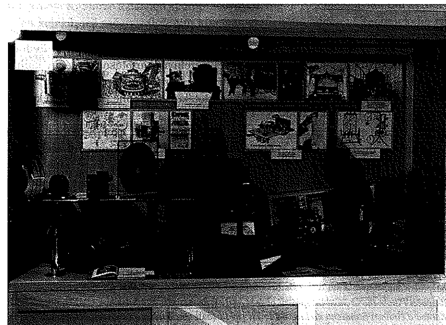
Vystavená část nejstarších sbírkových předmětů kinematografického oddělení Technického muzea.