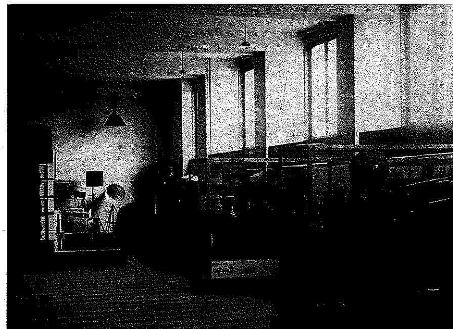
Část interiéru muzejní expozice kinematografického oddělení Technického muzea.