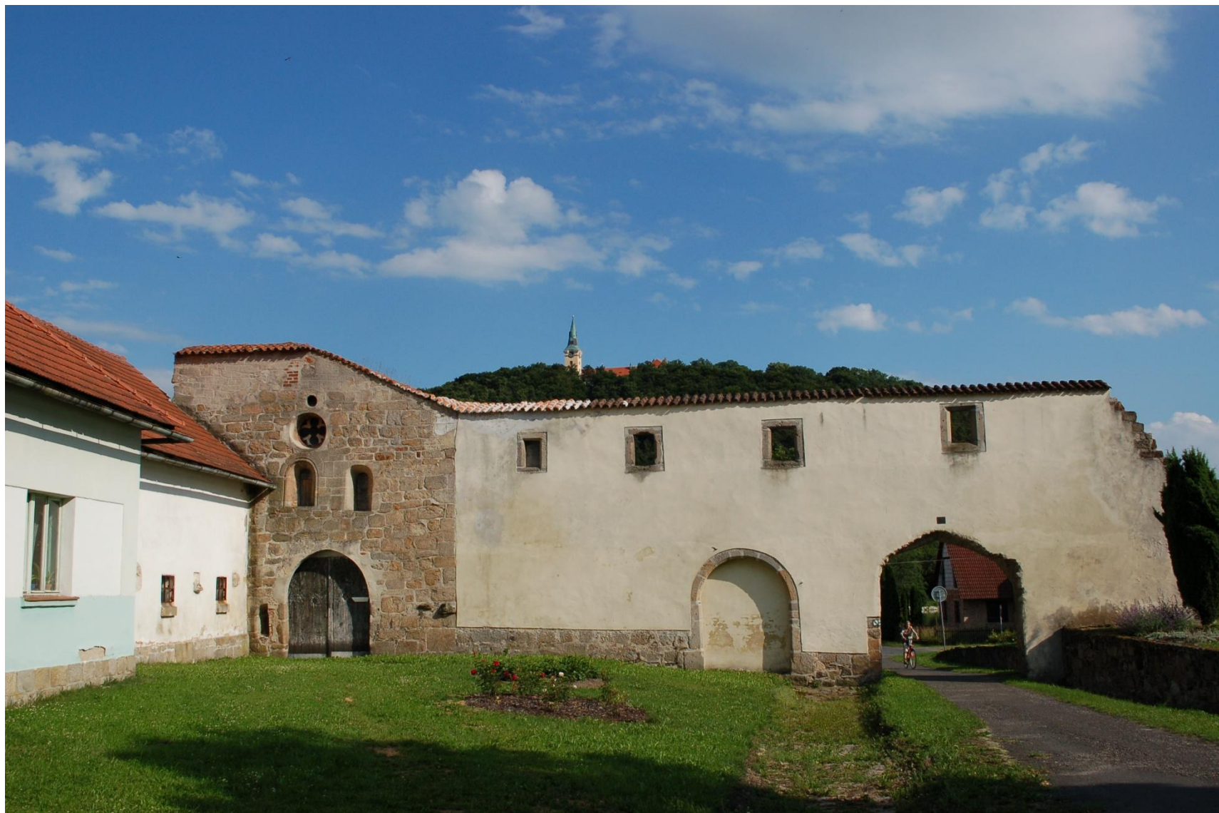
Část někdejšího kláštera