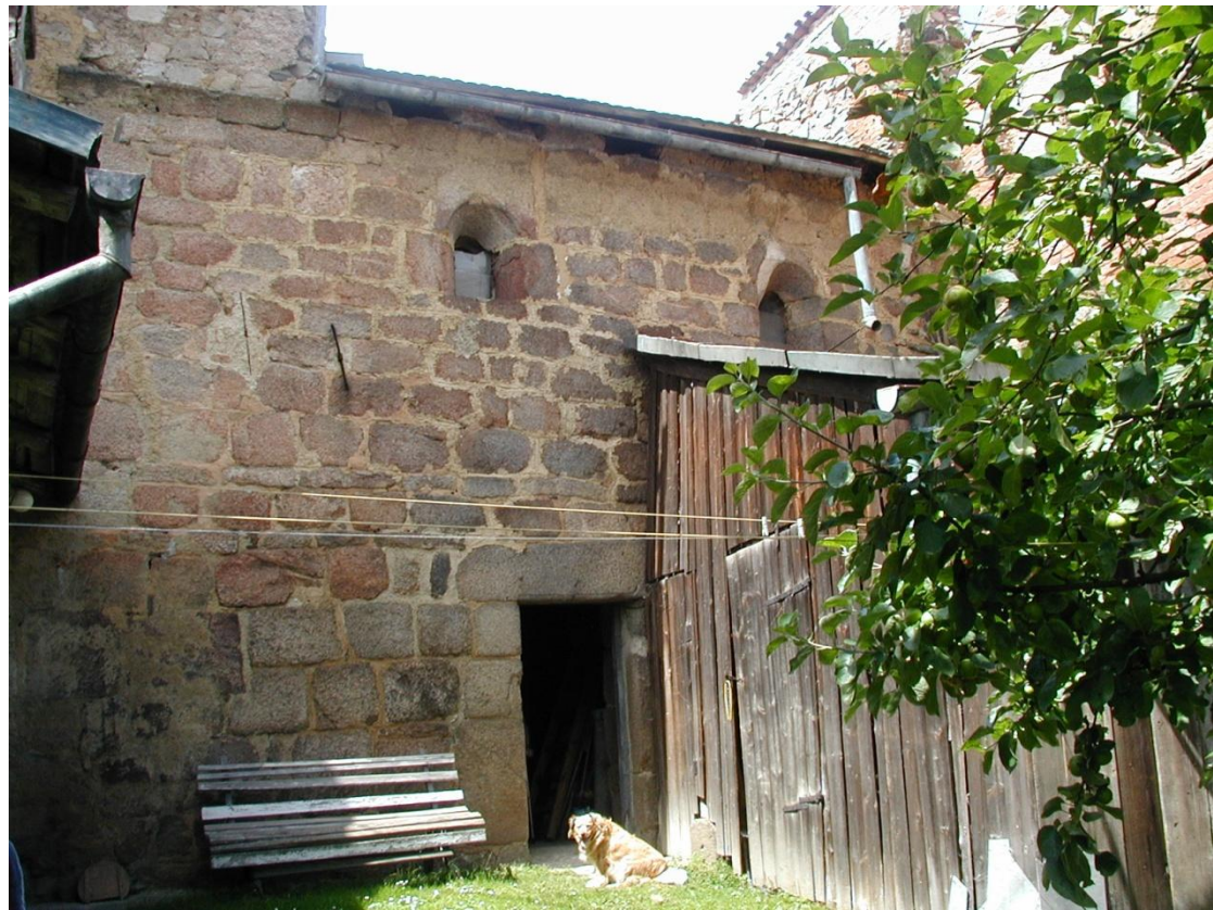
Budova někdejšího kláštera (cca 1230).