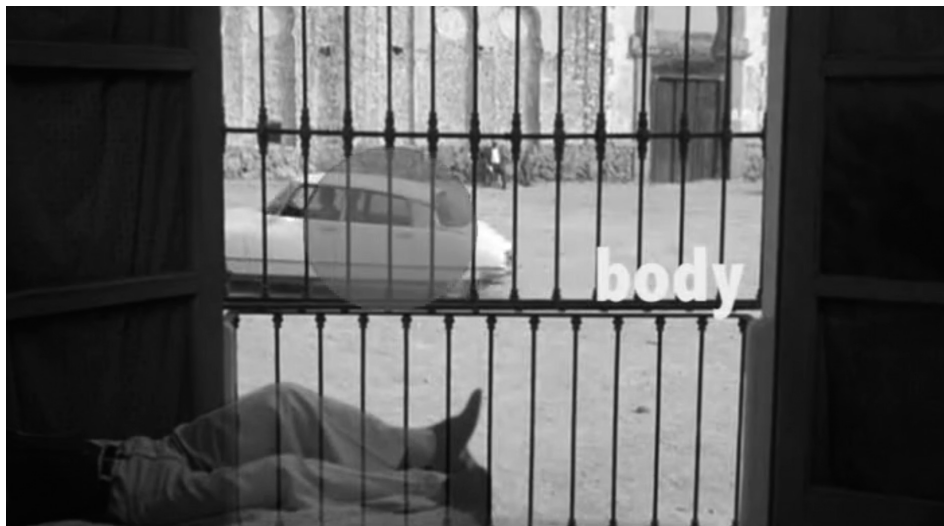
Obr. 1: DEAD TIME

-badatel klade vyšší cíle než jen efektně sestříhat dominantní stylistické postupy z tvorby kanonických autorů, naráží minimálně na dvě úskalí. Zaprvé musí krotit sklony k zevrubnému komentování scén: hrozí tak účinek „zdvojování“ 59) při kterém je audiovizuální hmota redukována na ilustraci mluveného slova. A zadruhé nemá nad obrazy takovou kontrolu, jaká by se dala očekávat: 60) ani důmyslné zpomalovací efekty či stop-záběry nedokážou zabránit, aby mu alespoň část kompozice neunikla. Ani komplexní videografické rozbory stylu, jako je studie Erlenda Lavika STYLE IN THE WIRE (2012), 61) se těmto zákoutím úplně nevyhnou. Jakkoli se Lavikova esej tváří jako odborná analýza, na mnoha místech prorůstá intuitivními, subjektivně zabarvenými poznatky (například když hovoří o použití dokumentární kamery), a změnou formátu ze 4:3 na 16:9 navíc narušuje stylistické vlastnosti původního materiálu. Není tedy překvapivé, že zastánci (neo)formalistického přístupu zvyklí rozebírat filmy políčko po políčku využívají audiovizuální formát především k doplnění či znázornění argumentů z tištěných studií. 62) Close reading ovšem nelze považovat za výhradní doménu formalistických metod: jak tvrdí například Eugenie Brinkemová ve vztahu k afektové teorii, detailní textuální analýza představuje cestu, jak