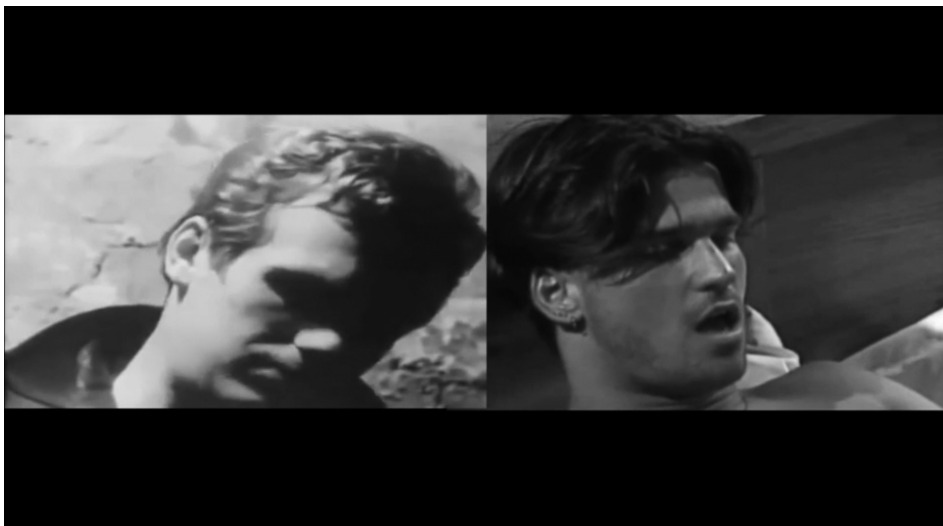
Obr. 3: FLOW/JOB

středí pouze na velké detaily Stefanovy tváře, bez explicitních záběrů sexuálního styku či protizáběrů partnerů. Zároveň tyto obrazy ve split-screenu porovnává s ikonickými záběry DeVerena Bookwaltera z Warholova experimentálního snímku BLOW JOB (1963), kterým přizpůsobuje jak formu (nápodoba zrnitého 16mm obrazu), tak rychlost (zpomalení přes program Optical Flow). Dosahuje tak dvou komplementárních efektů, jež souvisejí s ontologickými otázkami audiovizuální eseje. Na úrovni performujícího těla se daří přerhat strojovou, gratifikační logiku pornografie ve jménu tajuplnější erotické slasti, která se zrcadlí ve znovunalezené mikrofyziognomii Stefanovy tváře, jakož i v mimozáběrovém dění, jež je záměrně ponecháno ve skrytu. Představy ohledně „pasivní“ homosexuality a „aktivní“ heterosexuality jsou tím narušené, ne-li přeznačené.