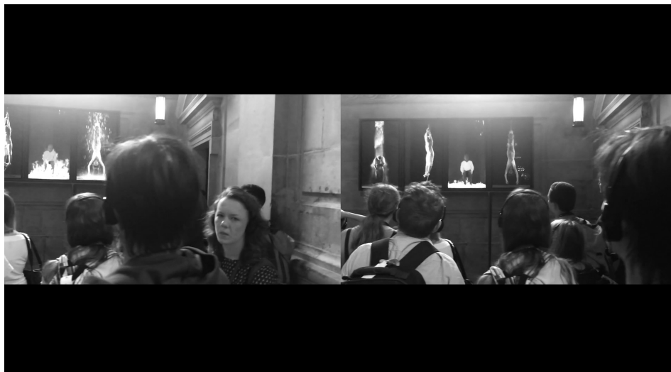
Obr. 4: MARTYRS FOR THE MASS

Neprobádanou cestu k teoretizaci diváctví nastiňuje především dílo MARTYRS OF THE MASS (2017) Kevina B. Leea a Kriss Ravetta, 82) kteří využívají pro audiovizuální esej velmi netradiční formu vlastnoručně natočených záběrů. Leeova a Ravettova studie jde přímo ke zdroji: při natáčení videoinstalace Billa Violy MARTYRS (EARTH, AIR, FIRE, AND WATER) v londýnské Katedrále svatého Pavla zachycuje i dojmy přicházejících a odcházejících diváků. Čtyři obrazovky, na kterých jsou křesťanští mučedníci drceni zemskými živly, svým obsahem vybízejí k emocionálnímu vnoření, avšak technické zpomalení na hranici percepčních možností (de)formuje gesta do podoby, v níž není jasné, zda odkazují k přechodu od jedné emoce k druhé, ikonické funkci utrpení nebo k transcendentní zkušenosti osvětlení. 83)