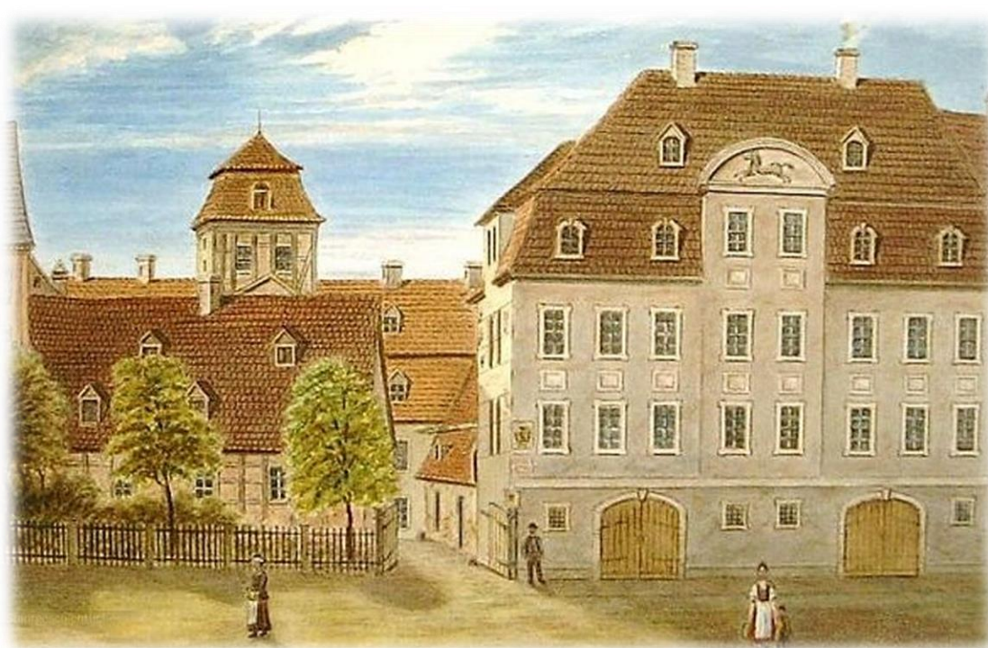
Budova školy v současnosti