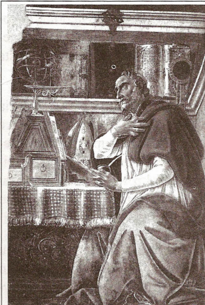
Svatý Augustin (Boticelliho freska) Obrázek 32

Podle jiných pramenů však sv. Augustin o možnosti spasení neslyšících nepochyboval a dokonce prý věřil, že mohou nabýt víry pomocí znakového jazyka, protože znaky považoval za „viditelná slova“. Není to však příliš pravděpodobné, protože kdyby tomu tak skutečně bylo, nikdy by patrně nevznikla tzv. orálně-manuální kontraverze a statut znakového jazyka by byl podstatně vyšší.