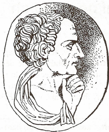
Aristoteles Obrázek 30

Alexandrem Velikým. Když nastoupil Alexandr na trůn, zřídil Aristoteles v Aténách filozofickou školu, nad kterou držel panovník ochrannou ruku. Po smrti Alexandra Velikého však byl Aristoteles obžalován z bezbožnosti a musel se zachránit útekem na ostrov Euboa v Chalkidě, kde také zemřel.