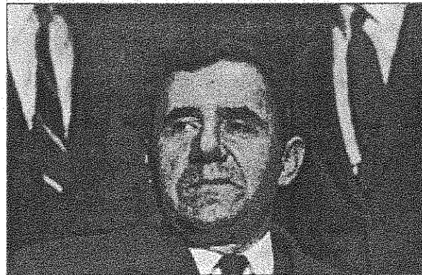
A. Gromyko, ministr zahraničí v letech 1957-1985

vy vlády byl dosazen konzervativní Nikolaj A. Tichonov. V samotném aparátě ÚV KSSS byli Brežněvovi klienti jmenováni do vedení všech důležitých oddělení i do sekretariátu. Vytvořila se zde tzv. dněpropetrovská mafie, neboť Brežněv „povyšoval“ zvláště ty funkcionáře, které důvěrně znal ještě z dob svého působení v hutnickém kombinátu v Dněprodzeržinsku a ve stranických orgánech v dněpropetrovské oblasti na Ukrajině. Současně si ale kultivoval vztahy s předáky jiných klik. Tímto způsobem se vytvořila situace, kdy vládnoucí elita reprezentovala zájmy nejen široké palety institucí a byrokratických klik, ale také regionů SSSR. V nové delikátní situaci ovšem musely být uspokojovány zájmy všech důležitých aktérů, což byla finančně a ekonomicky velmi nákladná záležitost. Partikulární zájmy vedly, výrazně zvláště od 70. let, i k jistému rozdělení země na „pašaliky“, vyčleněné pro tu kterou skupinu.