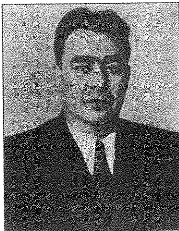
L. Brežněv v 50. letech

V sovětské hierarchii byl však zatím jen primus inter pares . Skutečné kolektivní vedení tvořili spolu s ním po odstranění Chruščova předseda vlády Alexej N. Kosygin a Nikolaj V. Podgornyj, který v prosinci 1965 převzal po Mikojanovi funkci předsedy prezidia Nejvyššího sovětu, tj. formální hlavy státu. Velmi vlivné postavení měl Michail Suslov, tajemník ÚV KSSS od roku 1947, odpovědný za ideologii, propagandu a vztahy s cizími komunistickými stranami. Právě on přednesl v červnu 1957 projev odsuzující „protistranickou skupinu“, v říjnu téhož roku odsoudil Žukova a v říjnu 1964 posléze i Chruščova.