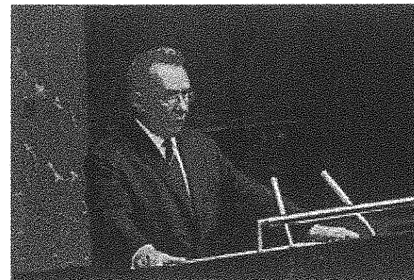
Předseda rady ministrů SSSR (premiér) A. Kosygin přednáší projev k delegátům Valného shromáždění OSN

Značnou pozornost však nová vláda věnovala civilní kontrole nad armádou, resp. její protiváze v podobě ministerstva vnitra a KGB, které měly k dispozici silné a výtečně vyzbrojené a vycvičené jednotky. Také pohraniční jednotky podléhaly KGB. Svým způsobem bylo charakteristické, že velké sklady vojenské výzbroje a všechny jaderné instalace a zařízení střežila vojska ministerstva vnitra, nikoliv armádní jednotky. Role KGB a dalších bezpečnostní složek rostla také díky silici kontrole nad obyvatelstvem