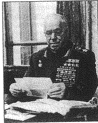
Maršál Georgij Žukov

Prezidium bylo kompletně rekonstruováno. Dostalo se do něj 9 nových členů, včetně Žukova a Brežněva, takže z 15 členů prezidia v tuto chvíli 12