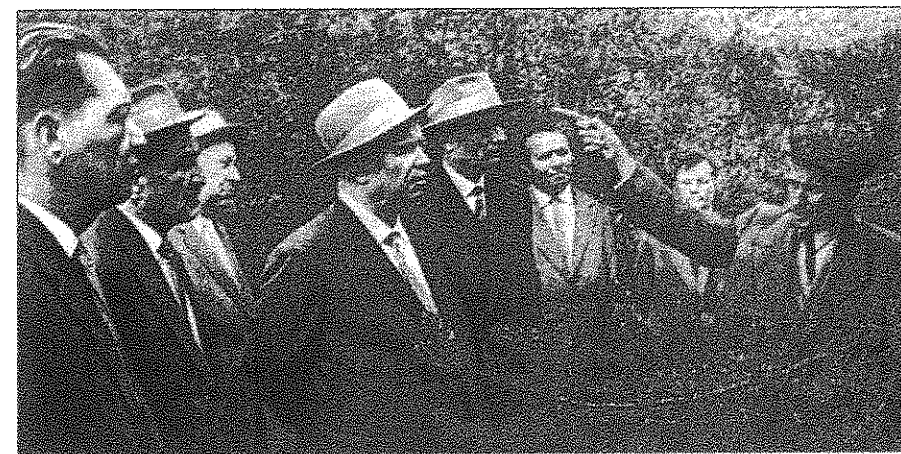
T. Lysenko vysvětluje „jarovizaci“. N. Chruščov uprostřed, vpravo od něj M. Suslov, druhý zleva A. Mikojan

Soupeření Chruščova s Malenkovem, charakteristické pro období po Berijově likvidaci, se odehrávalo zvláště na poli formulování a prosazování ekonomické politiky. Malenkov nastínil svoji zemědělskou politiku na zasedání Nejvyššího sovětu v srpnu 1953. Navrhl snížení a v některých případech i zrušení daní uvalených na zemědělství, stejně jako snížení nucených dodá-