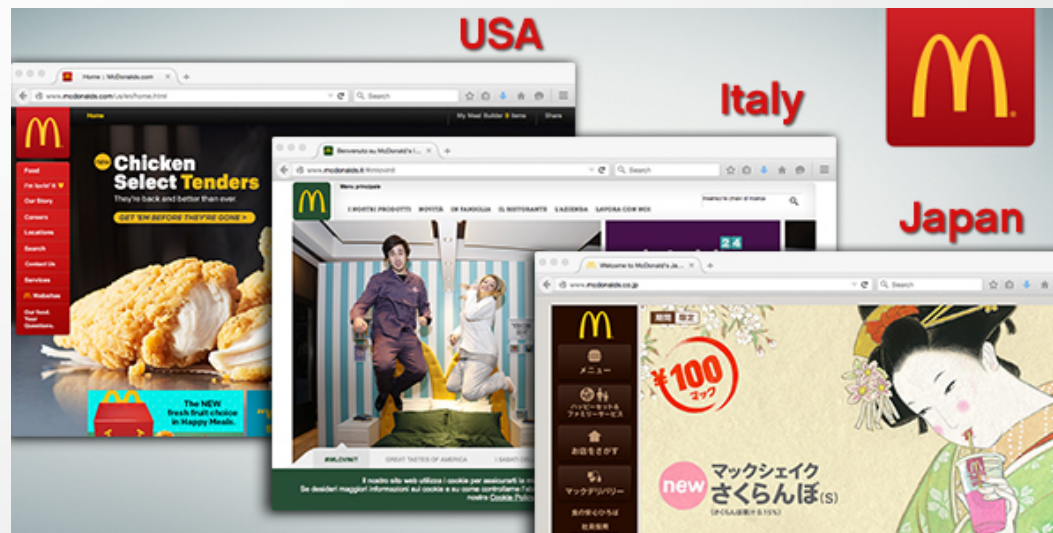
Obrázek 1 – Přizpůsobení loga kultuře