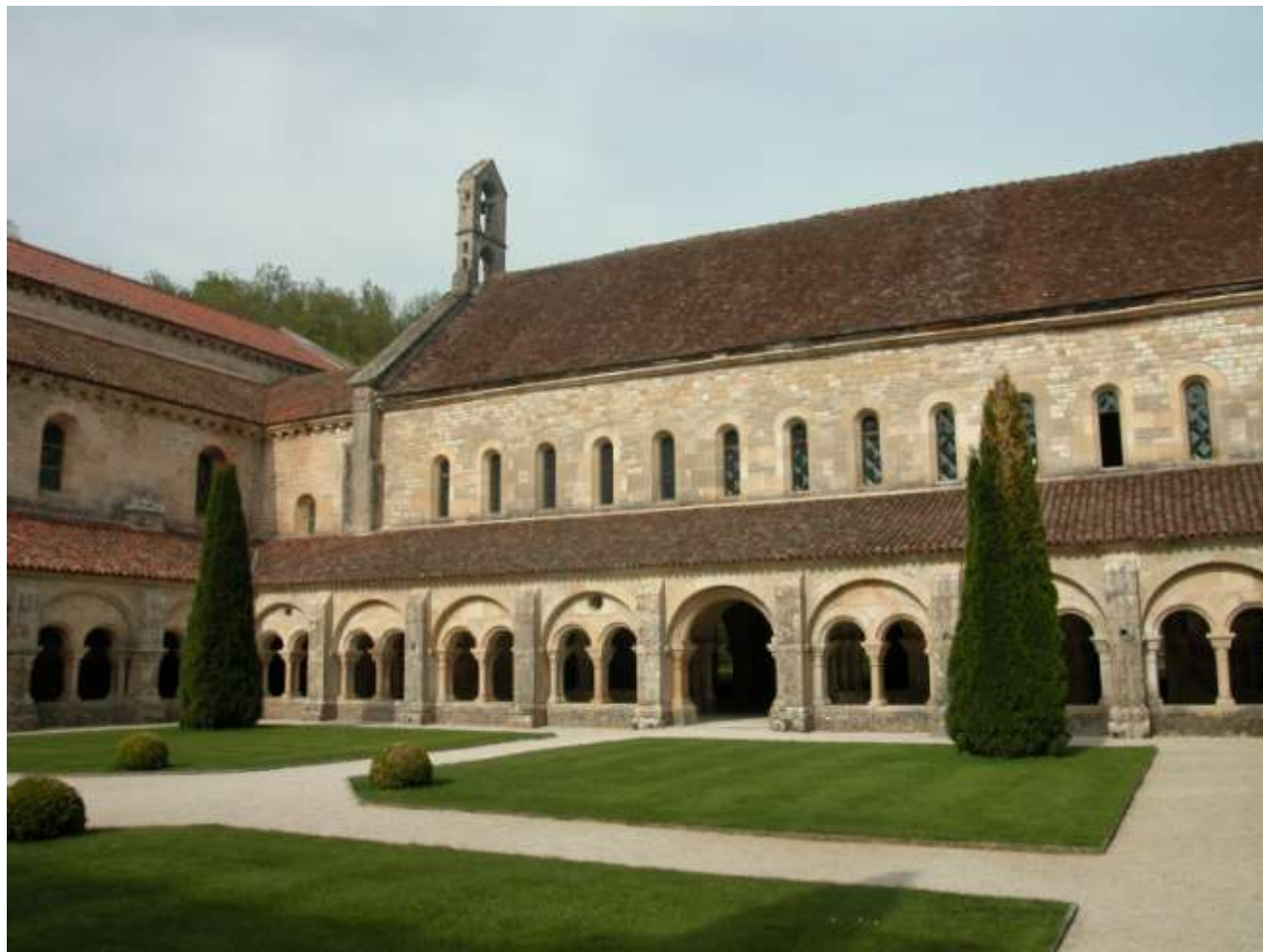
Fontenay 12. klášter řádu

1119 potvrzen cisterciácký řád V té době již 13 klášterů, všechny ve Francii