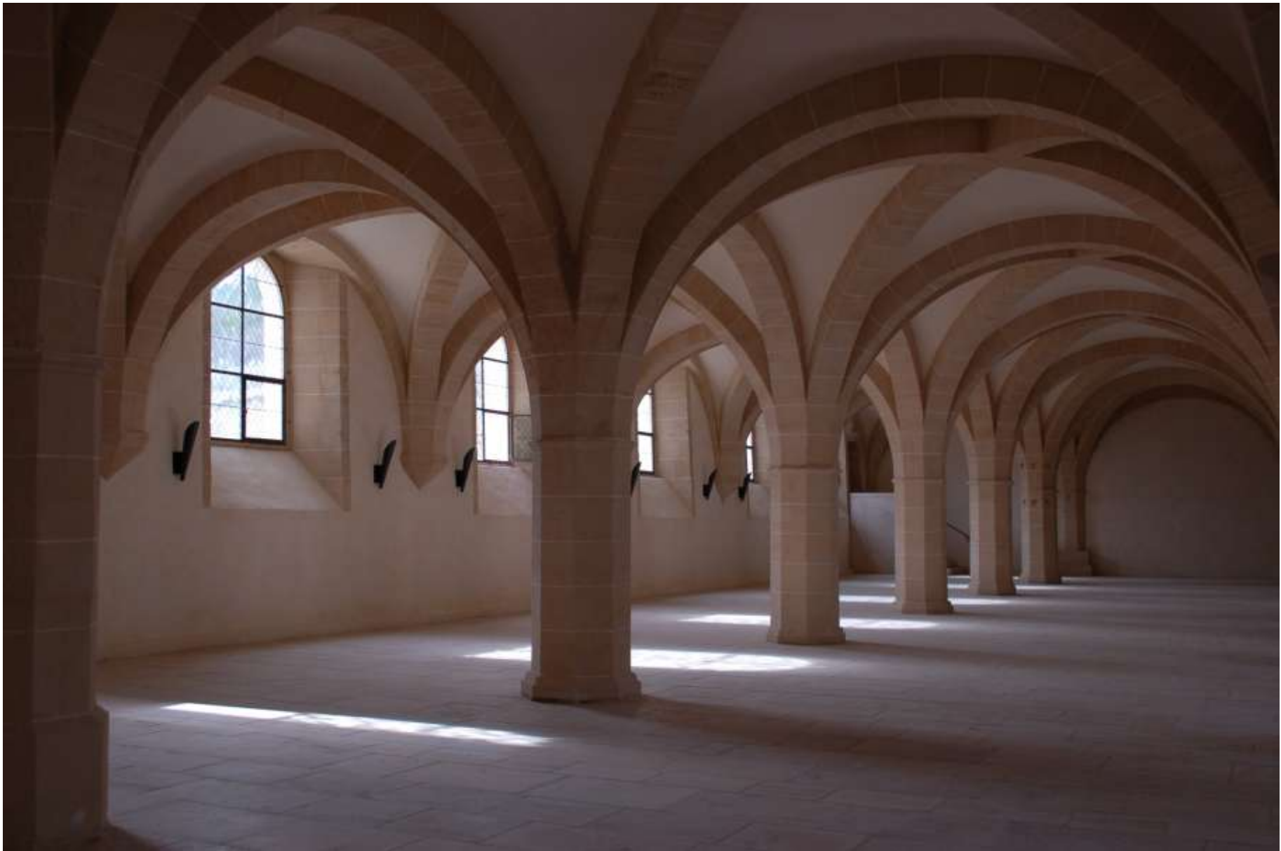
Clairvaux, konvršské křídlo