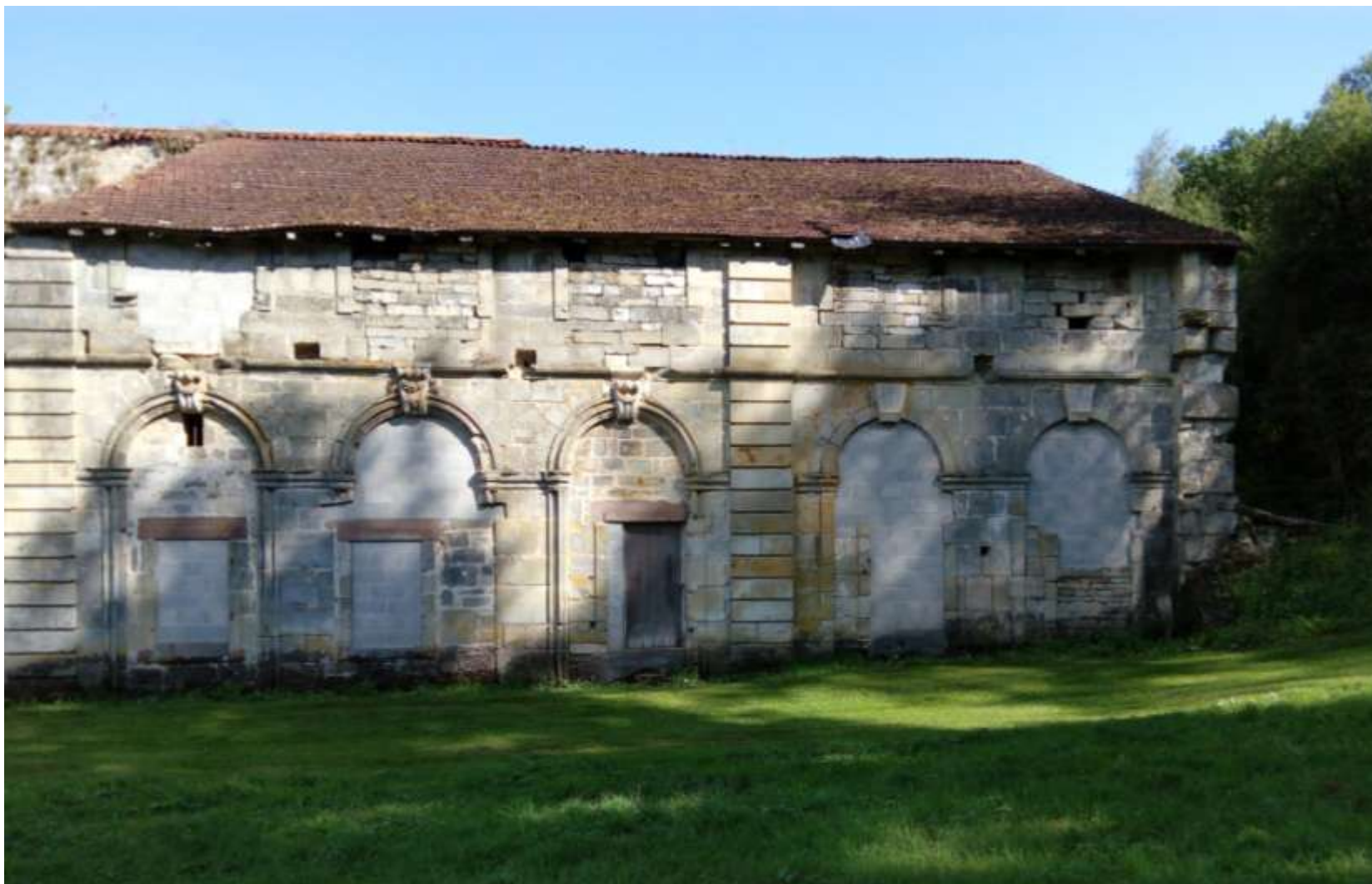
Morimond, pozůstatek konventního kostela