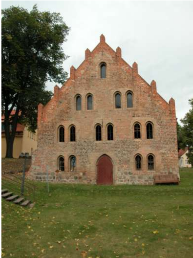
Lehnin, sýpka v areálu kláštera