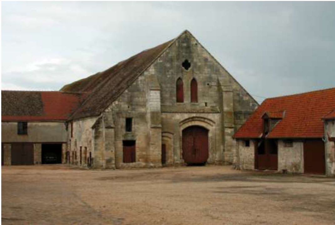
Grangie Fourcheret (Chaalis)

Půda má být spravována prostřednictvím hospodářských dvorů – grangií.