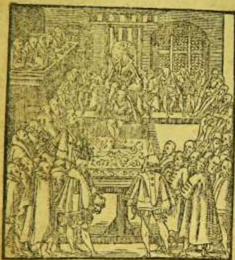
In Regno, Summi, Procerūq, Equitumq, Bohemo Iudicij Patres, denotat iste typus.