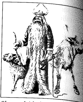
Slovanský boh podsvetia Veles s atribútmi býčích rohov.

Smrť bola chápaná ako nevyhnutná a zároveň nepredvídateľná. U mnohých národov je rozšírená viera, že žiadny človek nevie, kedy umrie. Je isté len to, že napokon naozaj umrie. Tieto vlastnosti sú námietom mnohých folklórnych podaní, čo dokazujú aj nasledovné príslovia: Narodiť sa môže, umrieť musí. Smrti neujdeš, Smrti sa nevykúpiš. Smrti sa nevymodlíš. Smrť je