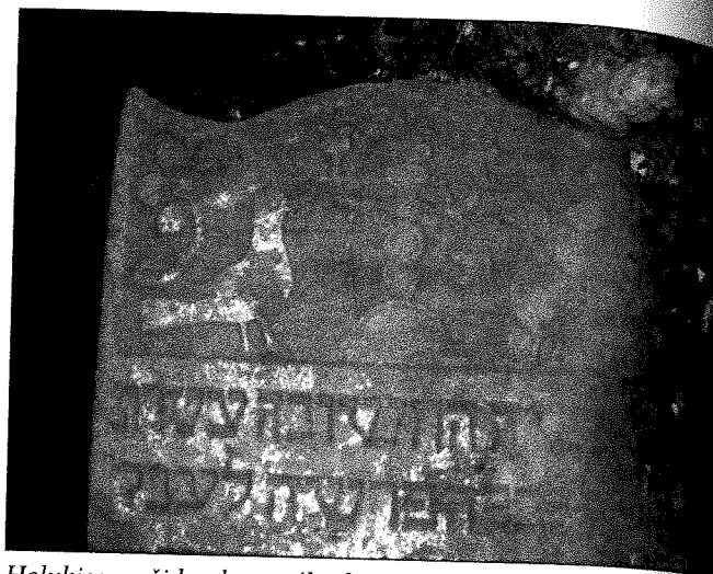
Holubice na židovskom náhrobnom kameni v Michalovciach. Zabudnutý židovský cintorín.

ktorého počet znamenal počet rokov zostávajúceho života. O spojitosti kuvika s prichádzajúcou smrťou vypovedajú aj slovenské príslovia: Umieračik volá: Kto za kým, kto za kým! A kuvik: Poď von, poď von! Alebo Ne počuje ten viac už kukučku kukat. 13 V Bukovej bola rozšírená predstava, podľa ktorej sa kuvik otočil vždy na tú stranu, odkiaľ prichádzala smrť, 14 a v Ružindole sa kuvika z tohto dôvodu snažili odohnať vždy, keď sedel na strome alebo streche v blízkosti ich obydlija. 15 V okolí Prievidze nazývali kuvika pôtikom , pretože kričal pôť, pôť , čím podľa nich volal chorého na druhý svet. 16