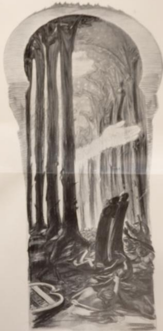
KARTON E BASSO „VISTA NARRATIVE A UNGARO“