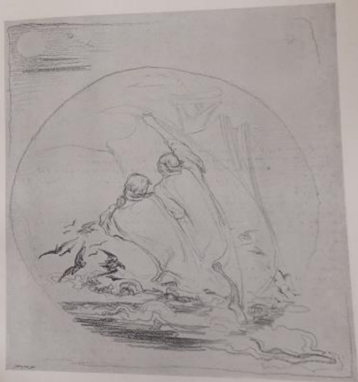
KRESBA K BASNI „RUCE“