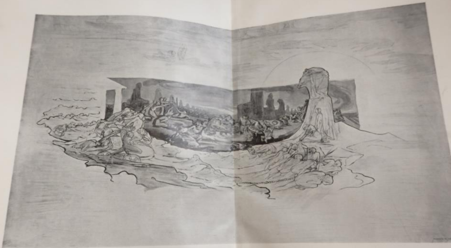
OBRAZ DOPROVODNÝ K „VEDRÁM“.