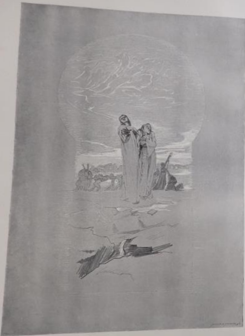
KRESBA K „SLEPCŮM“