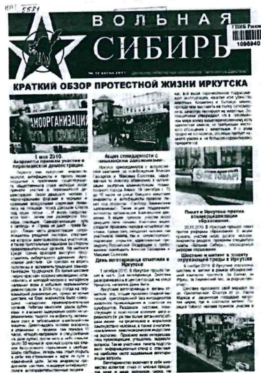
Газета «Вольная Сибирь». № 10 (2011)