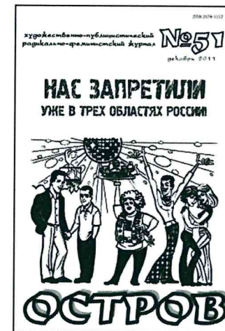
Журнал «Остров». № 51 (2011)

«Лабрис» скромно именовал себя информационным листком, и, как было написано в рекламных флаерах этого издания, распространявшихся на лесби-вечеринках, в его содержание входили «статьи феминистически-просветительского характера; информация о событиях в мире; ре-