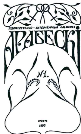
Альманах «Арабески». № 1 (1993)