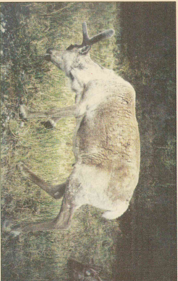
▲ Setkání se soby působí na dnešního člověka většínou romanticky a exoticky

soby dráždit ani rušit. Sobi způsobil v Laponsku každoročně několik tisíc dopravních nehod. Nejsou sice tak nebezpeční jako půltunoví losi, kteří se vyskytují v jižnějších zeměpisných šířkách, ale srážka může být velice nepříjemná, zvlášť když v jejím důsledku zůstane vozidlo v nepojízdném stavu. Jedinou spo-