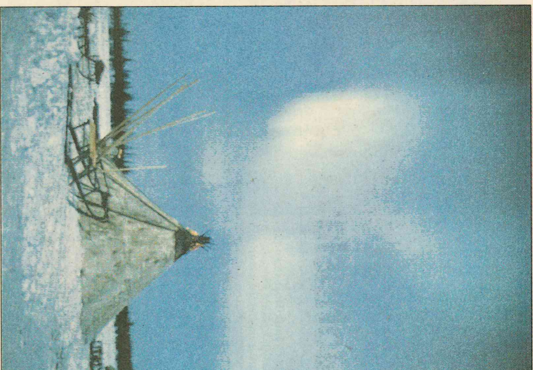
▲ Polární záře nad laponským stánem

tury, má pohnutou historii. Koncem války je Němci při ústupu z Finska srovnali se zemí, ale slavný finský architekt Alvar Aalto vyprojektoval v padesátých letech na spáleništi nové město s půdorysem ve tvaru sobích parohů. Dnes navštíví Rovaniemi ročně asi půl milionu turistů.