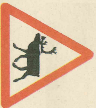
▲ Bežná dopravní značka na laponské silnicích. Pozor sobi

soby dráždit ani rušit. Sobi způsobil v Laponsku každoročně několik tisíc dopravních nehod. Nejsou sice tak nebezpeční jako půltunoví losi, kteří se vyskytují v jižnějších zeměpisných šířkách, ale srážka může být velice nepříjemná, zvlášť když v jejím důsledku zůstane vozidlo v nepojízdném stavu. Jedinou spo-