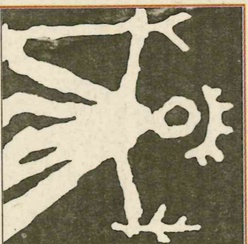
▲ Laponská bohyně Máttar Ahkku (zdroj veškerého života) je symbolem plodnosti a tvorivosti

Laponci jsou velmi starý uralský národ se svébytnou kulturou a vlastním jazykem, který je vzdáleně příbuzný finskému a od 17. století má i psanou podobu. Nemají rádi jméno, které jim přisoudili jejich skandinávští sousedé, když je vytlačovali na sever. A není se co divit, protože »lapp« znamená švédsky »hadr« nebo »záplata«. Laponci sami sobě říkají Sápmové a svou zemi nazývají Sápmi. Podle způsobu obživy se dělí na pobřežní Sámy, kteří se žijí především rybářstvím, a na lesní a horské Sámy, kteří jsou vynikajícími lovci a chovatelé sobů. Jejich tradičním obydlem je přenosný stan lávrri – asi tři metry vysoká dřevěná konstrukce kuželovitého tvaru se zá-