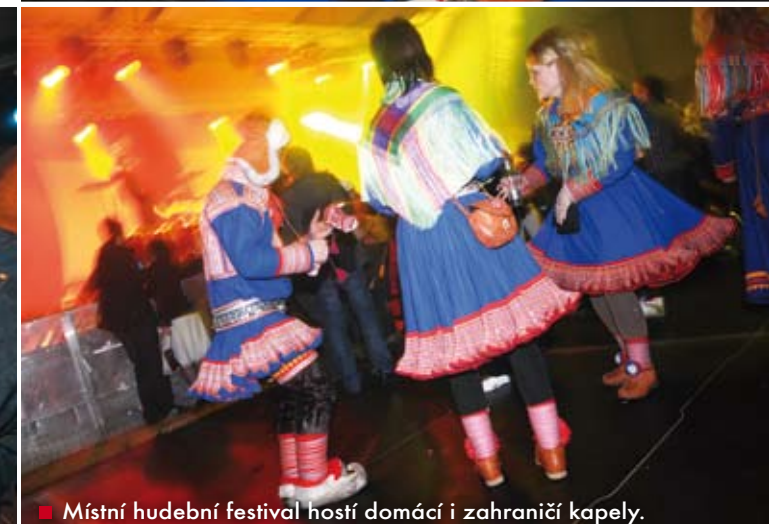
■ Místní hudební festival hostí domácí i zahraniční kapely.