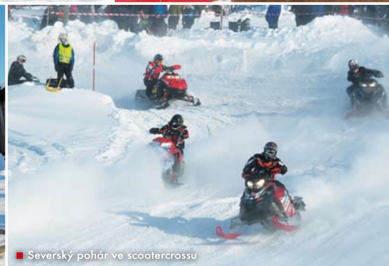
■ Severský pohár ve scootercrossu

nemělo proti arktickému mrazu šanci. Sámové běhali v lehkých papučích ze sobí kůže a bylo jim hej.