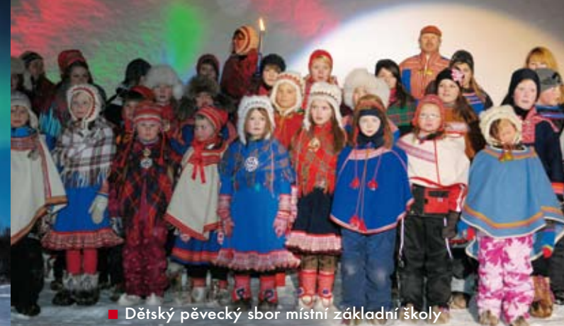
■ Dětský pěvecký sbor místní základní školy

Zhlédnout filmy chce odolnou povahu. Přes den se filmy uvádějí v místním kulturním domě, večer se však promítá venku ve volné přírodě. Každý rok se pro festival staví kino z ledu a sněhu a místní mu říkají ledové kino. Diváci sedí na sobích kůžích a sledují filmy na plátně – ze sněhu a ledu. Pro našince je to opravdový arktický, mrazivý zážitek. Promítání v létě není možné, neboť tehdy za polárním kruhem slunce dva měsíce nezapadá.