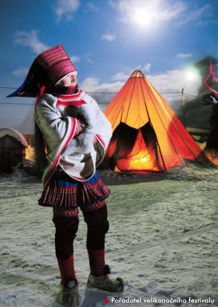
■ Pořadatel velikonočního festivalu