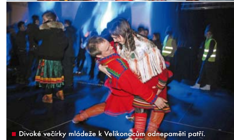
■ Divoké večírky mládeže k Velikonocům odnepaměti patří.