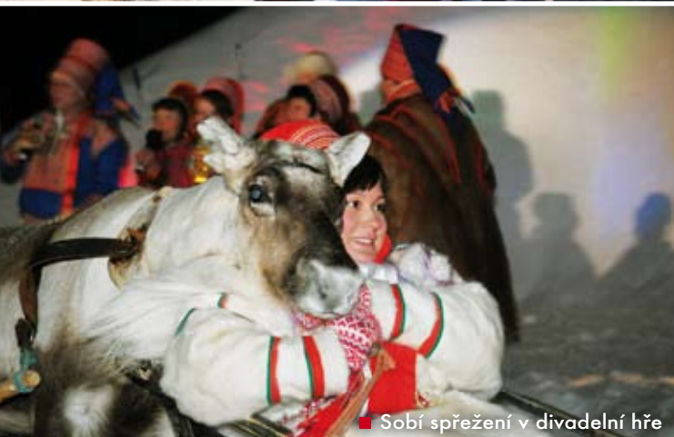
■ Sobí spřežení v divadelní hře