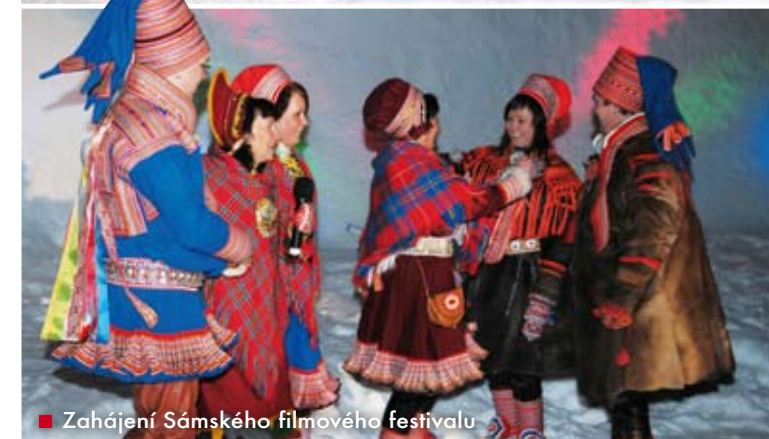
■ Zahájení Sámského filmového festivalu