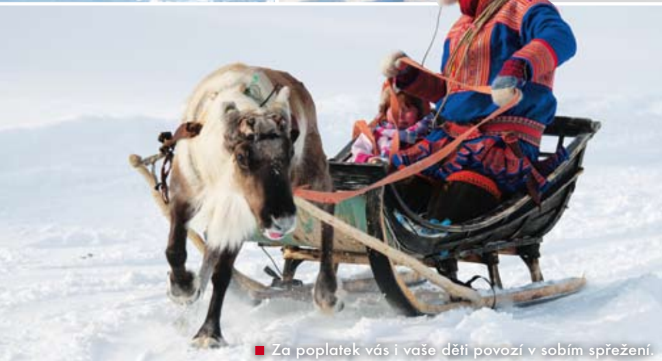
■ Za poplatek vás i vaše děti povozí v sobím spřežení.