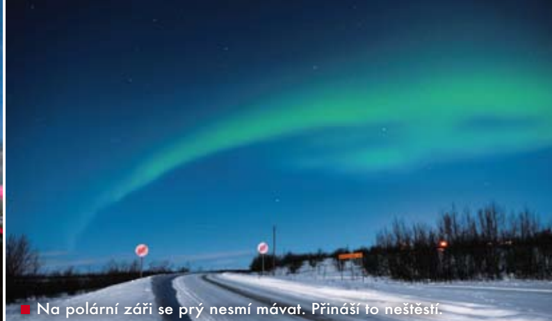
■ Na polární záři se prý nesmí mávat. Přináší to neštěstí.

Norů – přednostní právo na lov divoké zvěře a rybolov. Toto vše si Sámové vymohli po velkých protestech v 80. letech minulého století, kdy se norská vláda chystala v samotném srdci Sapmi postavit obrovské vodní elektrárny. Protestními hladovkami a blokadami stavby dali Sámové najevo, že oni jako původní obyvatelé mají právo rozhodovat o osudu svého domovského teritoria. Elektrárna byla sice postavena, ale od té doby se Sámové z celé Skandinávie stmelili pod společnou vlajku a žádají opatření zaručující zachování kulturního dědictví a rozvoj tradičních ekonomických aktivit v rámci skandinávských států. Výsledkem jejich úsilí bylo založení sámského parlamentu v roce 1989, zavedení televizních programů v sámštině a zřízení sámské univerzity. V několika správních okresech si Sámové vyžádali, aby byla sámština zavedena jako úřední jazyk.