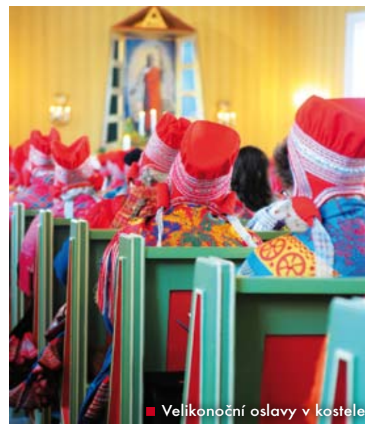
■ Velikonoční oslavy v kostele

Domorodý status garantuje norským Sámům jak kulturní a jazyková práva, tak i práva územní a politicko-správní. Chov sobů je vyhrazen výlučně Sámům, kteří mají garantováno využívání určitých lokalit na pastviny. Sámové také mají – k nevoli řady