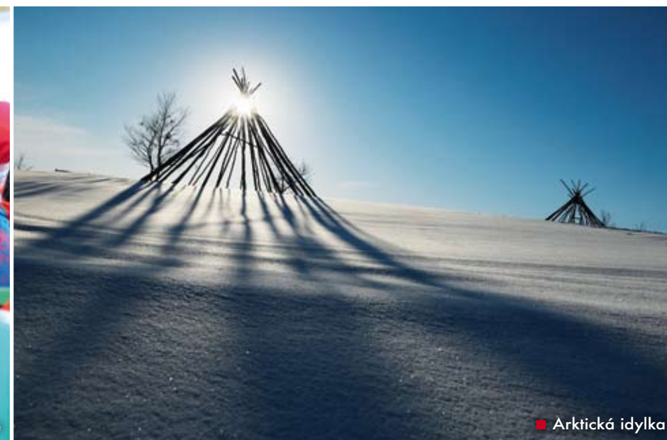
■ Arktická idylka