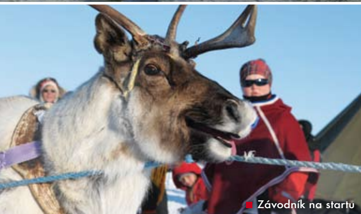
■ Závodník na startu

Na Sámském filmovém festivalu se upřednostňují filmy a dokumenty od sámských filmařů. Nechybějí ani filmy s domorodou a indiánskou tematikou z různých koutů světa. Letos se sešlo přes dvacet snímků. Například jeden finský dokument kritizoval těžbu lesů v severním Finsku, která bezohledně ničí bohaté pastviny pro soby místních Sámů. Zajímavý byl i dokument o sámské emigraci do USA a o zásluhách Sámů o zavedení chovu sobů na Aljašce. To, že Santu Clause táhne na saních sobí spřežení, je prý dílem těchto přistěhovalců.