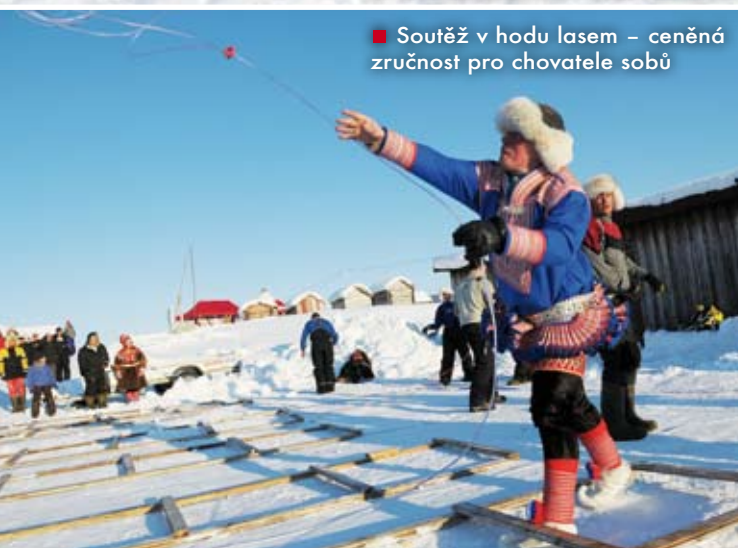
■ Soutěž v hodu lasem – ceněná zručnost pro chovatele sobů