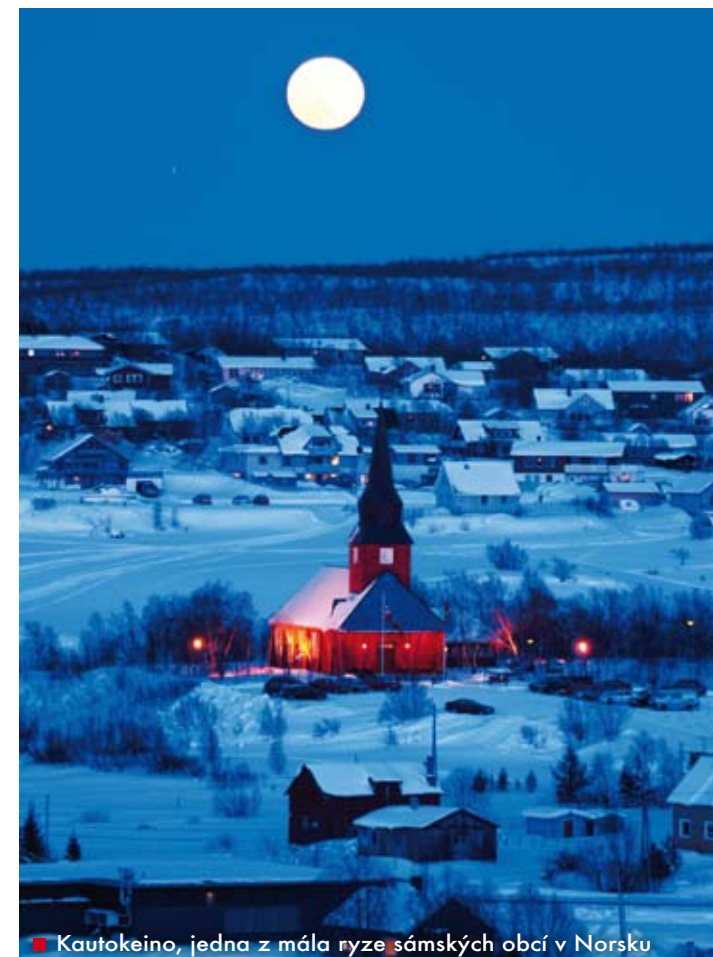
■ Kautokeino, jedna z mála ryze sámských obcí v Norsku

Když v sedmdesátých letech dvacátého století chtěli sámští reprezentanti v OSN usednout do výboru pro domorodé a indiánské