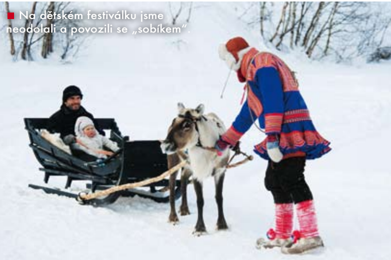
■ Na dětském festiválku jsme neodolali a povozili se „sobíkem“.