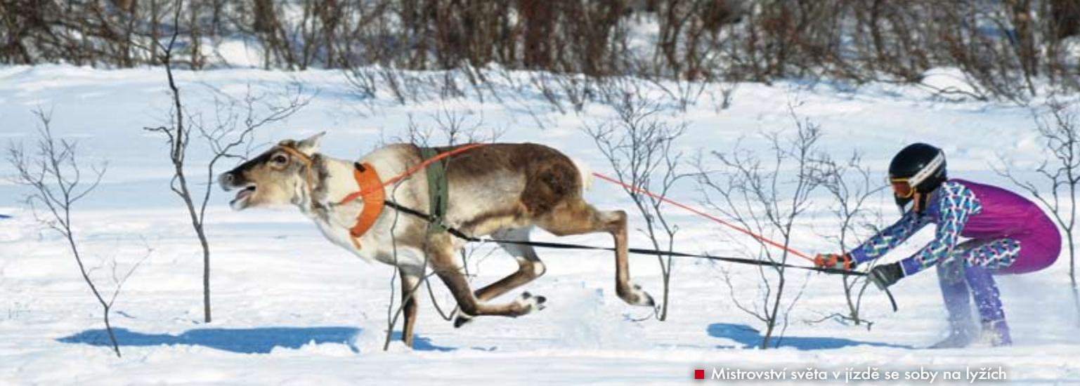
■ Mistrovství světa v jízdě se soby na lyžích