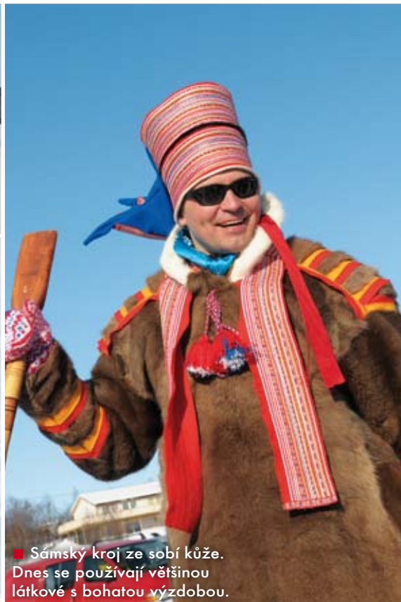
■ Sámský kroj ze sobí kůže. Dnes se používají většinou látkové s bohatou výzdobou.