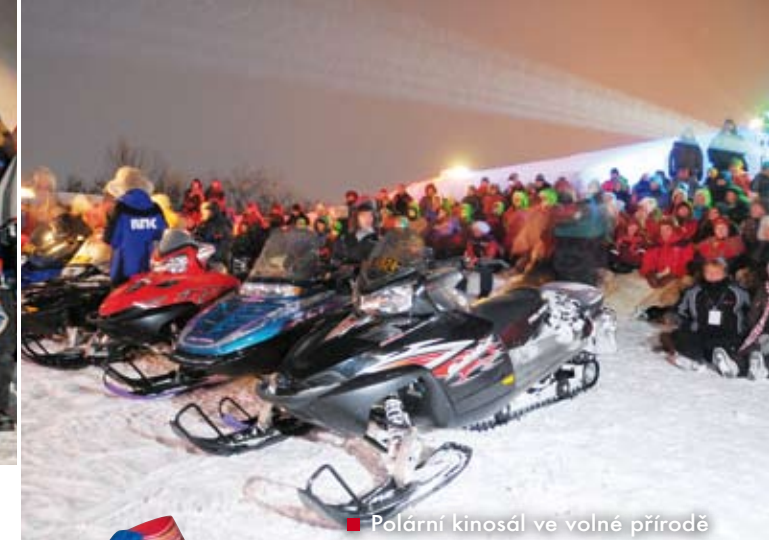
■ Polární kinosál ve volné přírodě

Z hlavního hitu večera – premiéry celovečerního filmu VZPOURA V KAUTOKEINU – jsme zběhale utekli s omrzlinami. V duchu jsem polemizovala s ochránci přírody o výhodách přírodních kožešin oproti uměle zateplenému oblečení, které