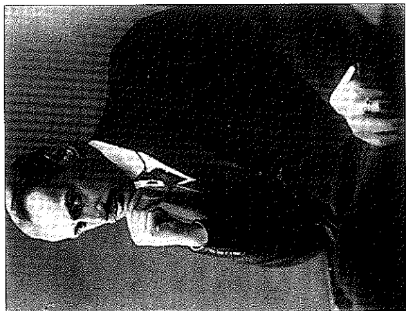
Hrabě Mihály Károlyi, první maďarský ministerský předseda a poslední prezident republiky

Ani souběžně vedená jednání Jásziho s rumunskými vůdci v Aradu nebyla úspěšná. 20. listopadu vyhlásili odtržení od Uher a koncem měsíce rumunské jednotky postoupily na demarkační čáru a poté, co sedmihradští Rumuni 1. prosince na shromáždění v Albě Julii vyhlásili připojení k rumunskému království, postoupily ještě za ní, až ke Kluži. Ačkoliv slovenský vůdce Milan Hodža inklinoval k přijetí autonomie jako prázatimního řešení do doby, než bude podepsána mírová smlouva, ostatní, a zejména Češi, se od něho distancovali, když požadovalo, aby Maďaři ustoupili za limity, jež se v později stala státní hranicí. Rusini byli jediní, kteří přijali nabízenou autonomii, neboť sjednocení celé Ukrajiny bylo nepravděpodobné. Když byla v Paříži 12. ledna 1919 zahájena mírové konference, ztratily Uhry již více než polovinu svého bývalého území i obyvatelstva. Jásziho detailně rozpracovaná myšlenka „Podunajských spojených států“ zůstala na papíře. Brzy poté začala být Károlyiho vláda stále častěji obviňována, že nepostupovala rozhodněji, zejména vůči Rumu-