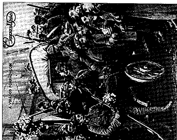
Vítězství „astrové revoluce“ 31. října 1918 v Budapešti