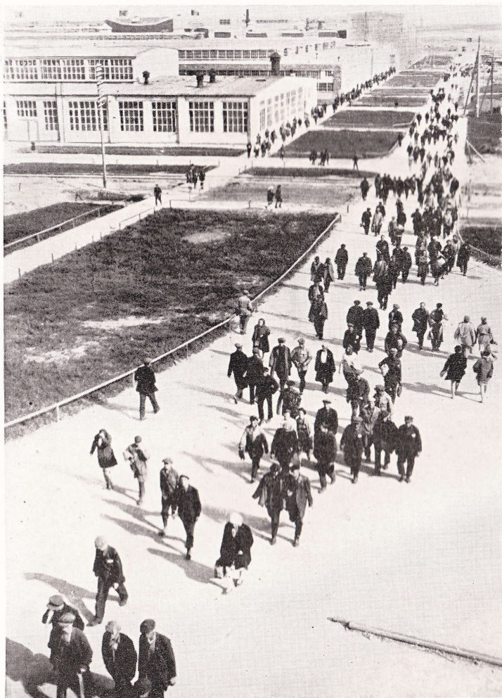
27 Dělníci Traktorstroje odcházejí z první směny