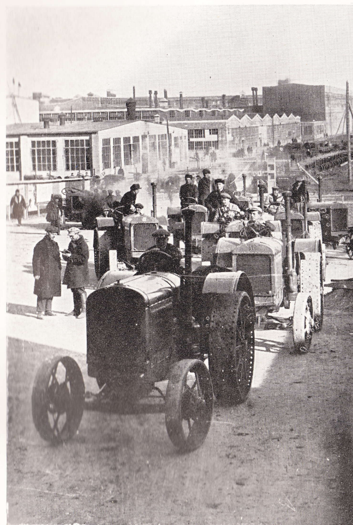
První traktory vyjíždějí z továrny 28